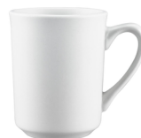
Tasse à café 150 unités