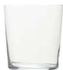
Verre à eau 150 unités